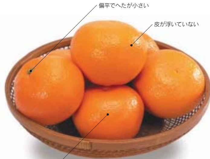
表面のきめが細かい

安房、夷隅、市原などの南房総にはみかんの産地があります。糖・酸相まった濃厚な味が特徴です。