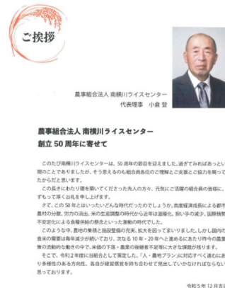
記念誌：代表理事あいさつ