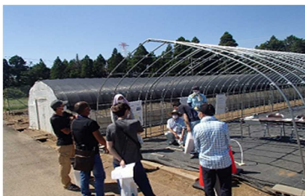
好評だった模型を用いた補強の解説