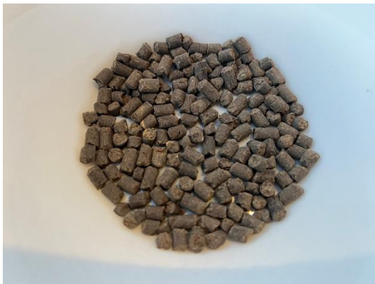
牛ふん堆肥等を原料とした指定混合肥

令和2年に肥料に関する法律の一部が改正され、今まで普通肥料の原料として使用できなかった牛ふん堆肥などが使用可能となり、一般農家でも取り扱いやすい形態で流通されるようになりました。今回は、今までリン酸、カリの補給がしにくかったコシヒカリの全量基肥体系で、牛ふん堆肥等を原料としたペレット状の指定混合肥料をその供給源として冬期に施用することを検証しましたのでご紹介します。