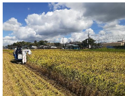
堆肥連用圃場における水稻の収穫の様