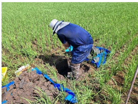
水田の土壌調査の様子

令和3～6年度に、県内の水田54地点、普通畑12地点の土壌調査及び土壌管理に関するアンケート調査を実施し、過去の調査結果との比較から、農耕地土壌の変化を明らかにしました。水田土壌の化学性は、概ね県の診断基準値以内でした。普通畑のイモ畑では、交換性石灰含量及び可給態リン酸含量が増加し、一方、交換性苦土及び加里含量が減少していました。水田及び普通畑ともに、地力の指標である可給態窒素含量が減少していました。