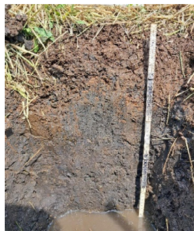
グライ低地土の土壌断