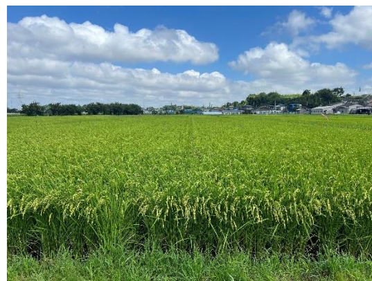
冬期に指定混合肥料を施用した水田