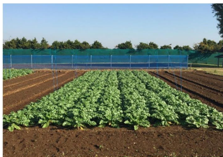
堆肥連用圃場におけるダイコン栽培の様子

堆肥の長期連用効果を明らかにする目的で、連用圃場において作物の栽培を毎年継続し、収量と土壌の変化を調査しました。作物の収量は、牛ふん堆肥を連用することにより、標準量の化学肥料単用栽培と比べて同等または同等以上を維持しました。また、野菜畑では堆肥2t、水田では1t/10a/年以上の連用により、堆肥の施用量が多いほど土壌の可給態窒素含量、交換性カリ含量は高く維持され、可給態リン酸含量は長期間増加することがわかりました。