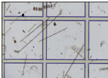
スケルトネマ属など (1月23日 船橋)