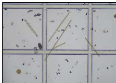
レプトシリンダラス属など (1月14日 富津)