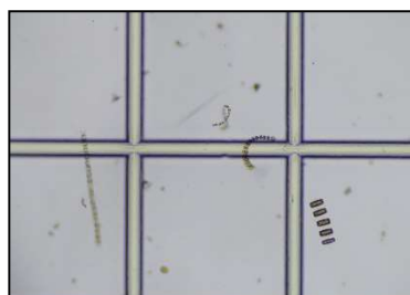
キートセロス属など (1月27日 大貫)