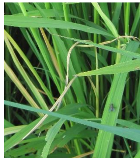
写真3 ゆうれい症状