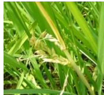
写真4 穂の出すくみ