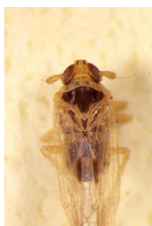
写真1 ヒメトビウンカ

本病の発生が懸念される地域では、苗箱施用などの薬剤防除を実施し、感染の抑制に努める。また、収穫後の早期耕うんや、ほ場周辺の雑草の除去（特にイネ科雑草）を行い、越冬虫数及び保毒虫率を下げるのが重要である。