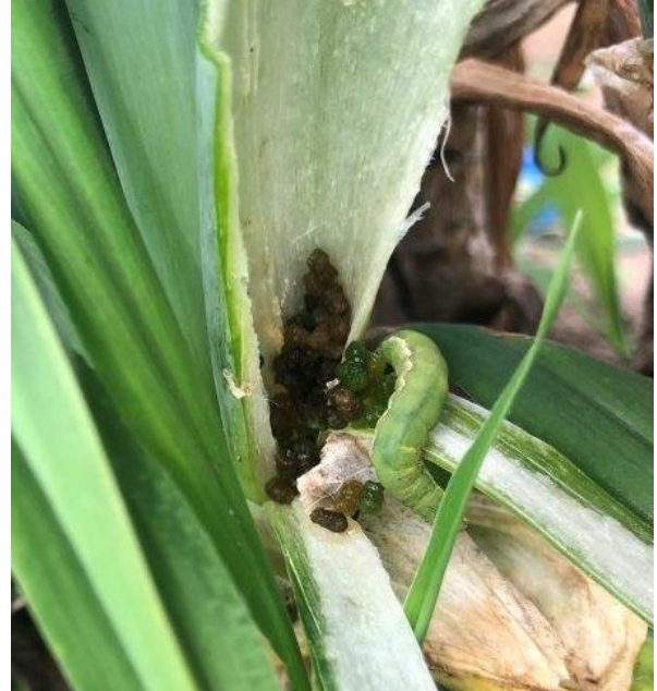
写真2 幼虫とネギ葉身内に堆積した糞