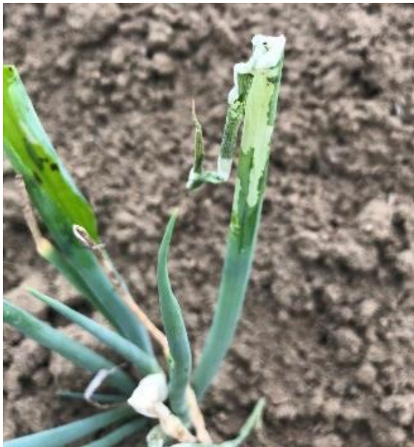
写真3 食害を受けたネギ (葉身の内側から表皮を残して食害)