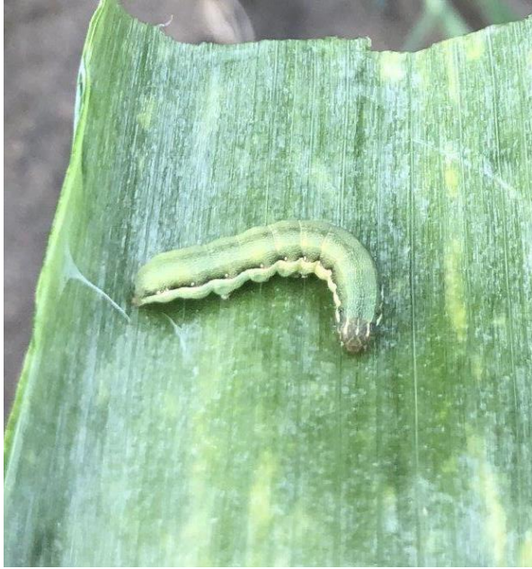
写真1 幼虫 (胴部側面の明瞭な白線が本種の特徴)