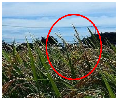
写真3 加害による被害穂 （青立ちした穂）