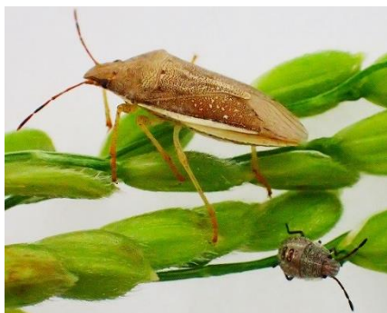
写真1 イネカメムシ成虫・幼虫