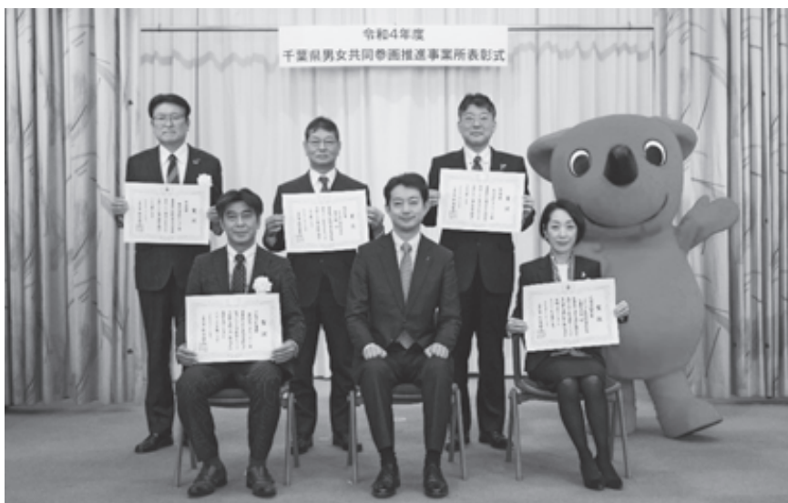
表彰式（令和5年1月24日実施）