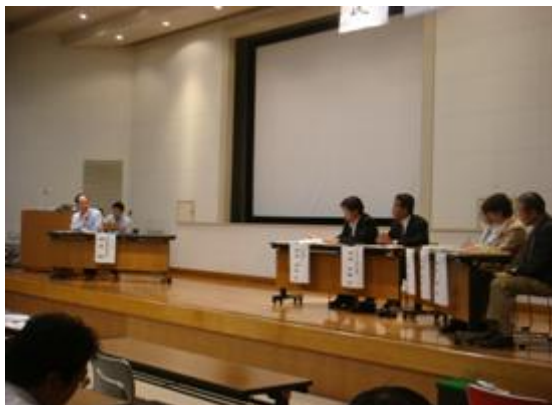
フォーラムの様子