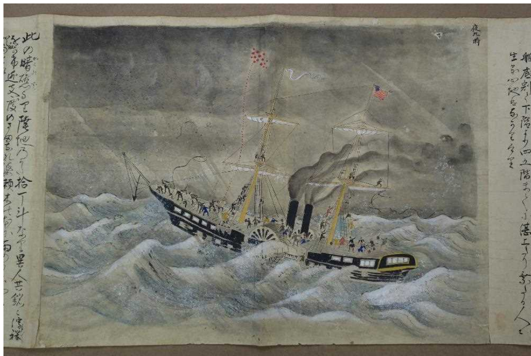
新指定① 明治二年奥州出征米国船ハーマン号勝浦沖遭難絵巻 (1巻15紙 縦：41.5 cm・全長：583 cm)