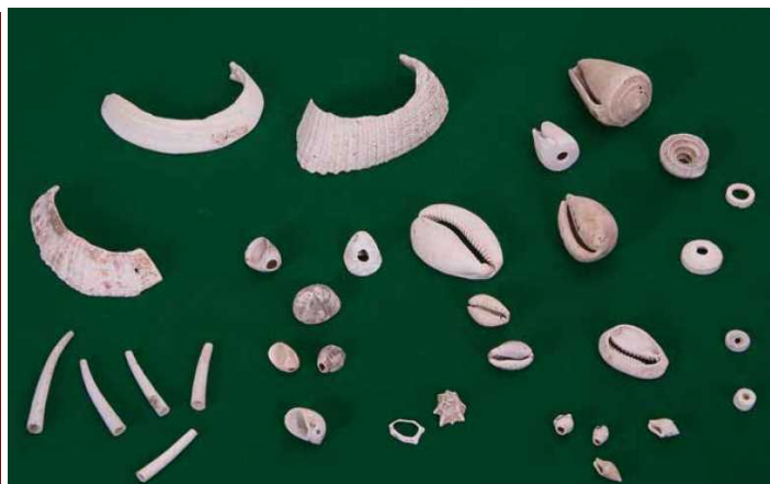
新指定② 西広貝塚出土骨角貝製装身具 (左：骨角製品、右：貝製品)