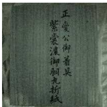
木箱 (蓋表赤外線写真)