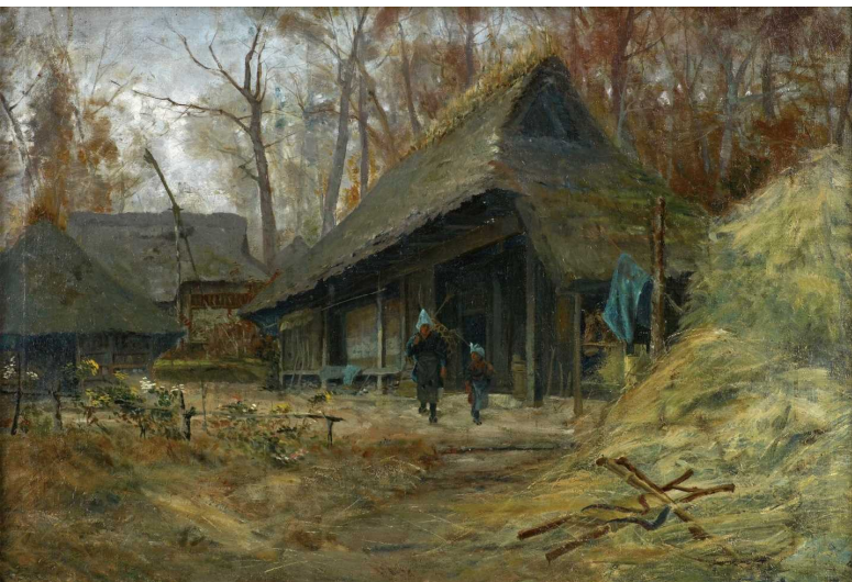
新指定-① 藁屋根〔浅井忠筆〕