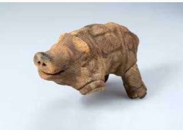
新指定-③ 能満上小貝塚出土土製品