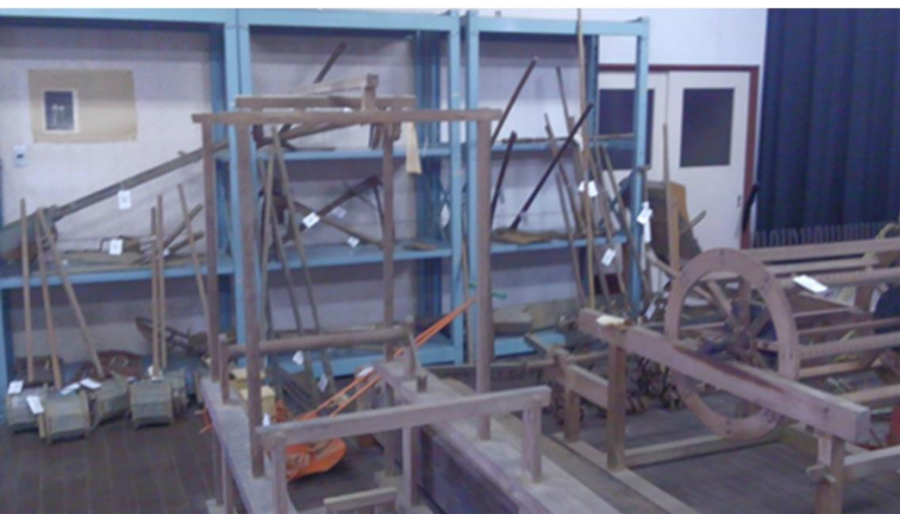
内容変更-① 農村生活用具