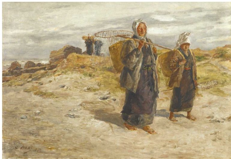
新指定-② 漁婦〔浅井忠筆〕