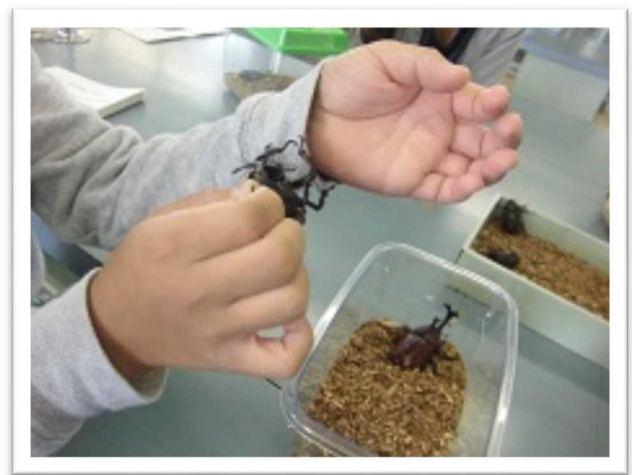
【カブトムシの配付】