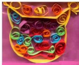
昨年度 作品展より