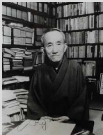
新村出 博士 (新村出記念財団提供)