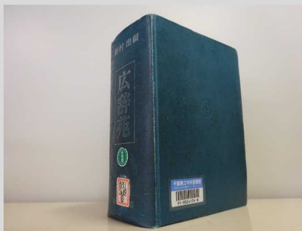
広辞苑 初版 (千葉県立中央図書館所蔵)

国語辞典の『広辞苑』をご存知の方は多いと思いますが、その編者である新村出博士をご存知でしょうか。言語学者で、日本の言語学研究の基礎を築いた一人で、日本語史研究や日本語と近隣諸語の比較研究、南蛮文化研究等に業績を残しました。