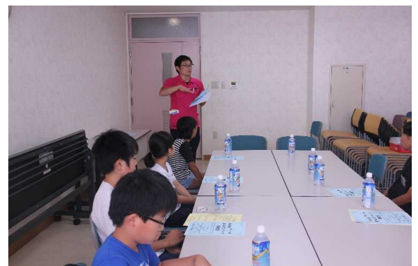
感想 質問 意見交流で終了