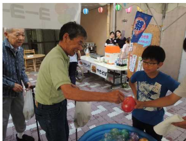
模擬店のお手伝い