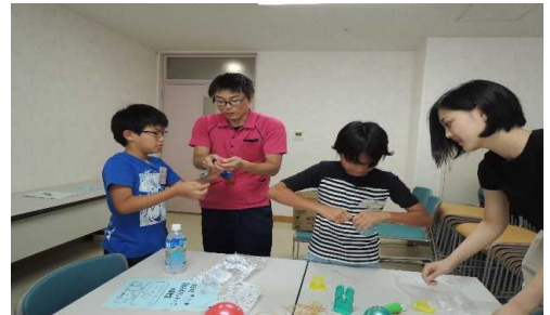
みんなで力を合わせて