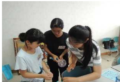
思っていた以上に難しい