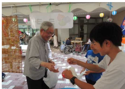
利用者とのふれ合い