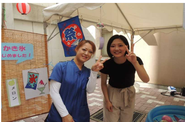
親子でハイポーズ