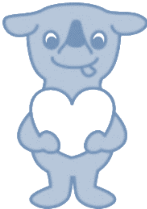
千葉県マスコットキャラクター 「チーバくん」