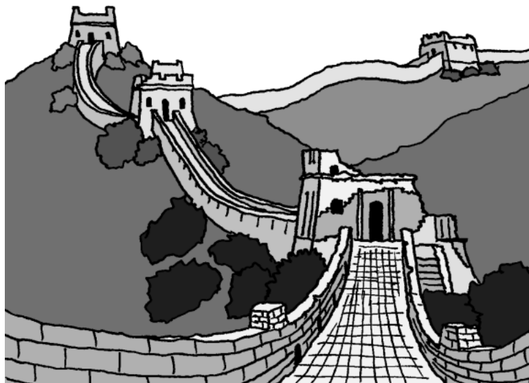
ばんり ちやうじやう 万里の長城