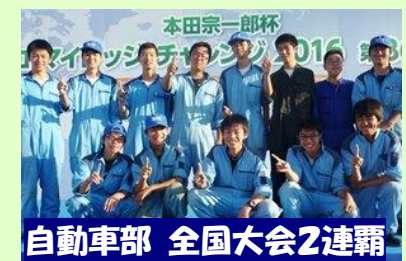
自動車部 全国大会2連覇

3つのプロジェクトを柱にした取組を実践しています。エコプロジェクトにおける自動車部のエコカー大会全国大会2連覇達成、地域交流プロジェクトによる近隣小・中学校への食育支援活動等、地域活性化プロジェクトによるオリジナル商品の開発や農業経営者育成の取組等、積極的な活動が特徴です。