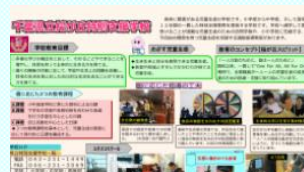
桜が丘特別支援学校