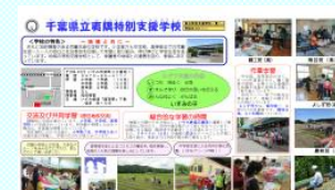
夷隅特別支援学校