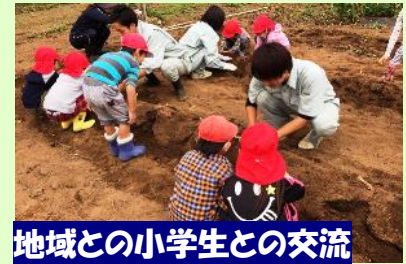
地域との小学生との交流

近隣保育所の園児とのサツマイモの栽培やボランティア団体・近隣小学校の児童との花壇の花植え活動等に取り組んでいます。情報科学科も進路決定率100%を目指し、1年生からの就業体験や大学・専門学校との連携による専門的な学びを実践しています。