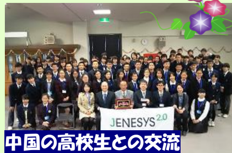
中国の高校生との交流

「特色ある教育課程」・「充実した国際理解教育と英語教育」・「発展的学習機会」の充実を3つの柱として、生徒を中心に様々な学習活動に積極的に取り組んでいます。特に国際理解教育に関しては、多くの選択科目の設定や海外への短期留学を行っています。