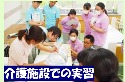
介護施設での実習

県内唯一の福祉教養科を有する高校で、福祉のスペシャリストの育成を目指しています。介護福祉士国家試験の合格率は91.7%を誇り、更に企業や大学等との連携により、最先端の介護技術を学んでいます。また、普通科においても福祉コースの設置により福祉教育が充実しています。