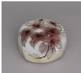
鉄絵銅彩椿文陶皿 2010 マスミフードサービス蔵