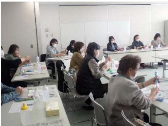
真剣に「美」を追求します