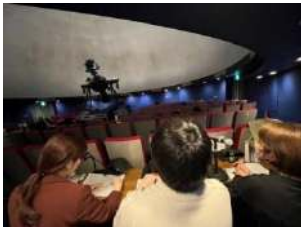
生の声で朗読をお届けします

②午後： https://kimikame.net/event/event?id=12215108