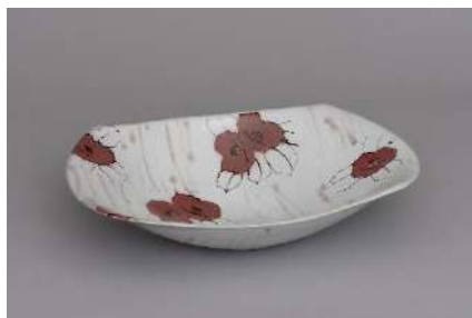
鉄絵銅彩秋海棠文壺 2025 作家蔵