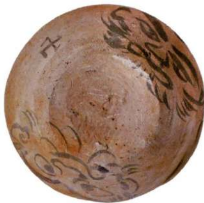
人面墨書土器 （市川市：北下遺跡）