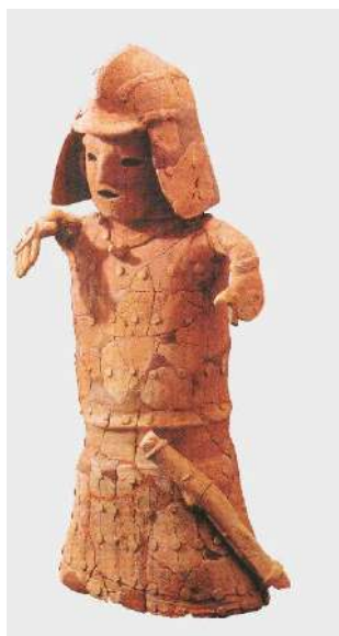
武人埴輪 （山武市：小川崎台3号墳）

展示解説（2月14日）やワークショップ（指組紐づくり）（1月31日）、講演会（2月15日）などの関連イベントもありますので、あわせてお楽しみください。