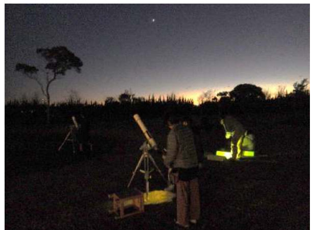
天体望遠鏡で観察します