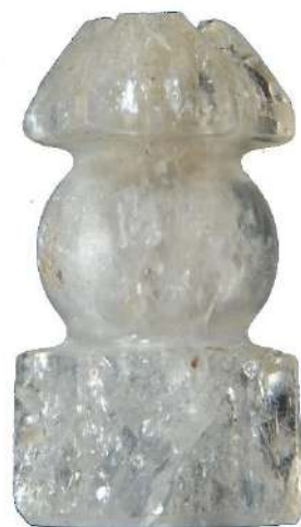
水晶五輪塔 （木更津市：笹子城跡）