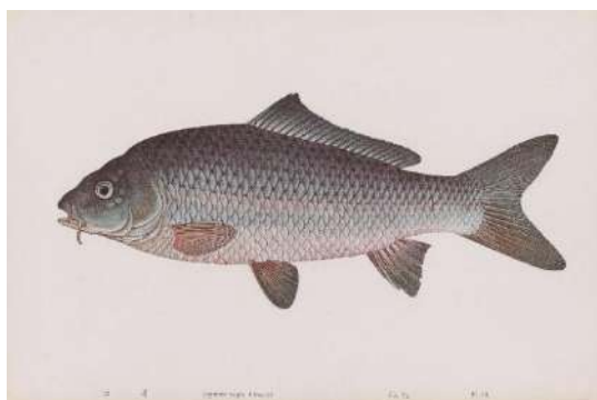
『日本魚介図譜 第3集』より コイ