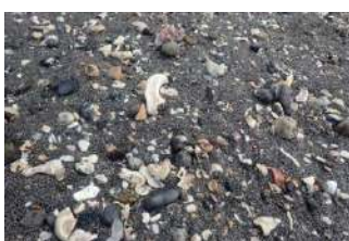
自分だけの宝物を見つけましょう

⑲ https://kimikame.net/event/event?id=12214905