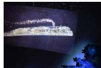
美しい映像と音楽に合わせます