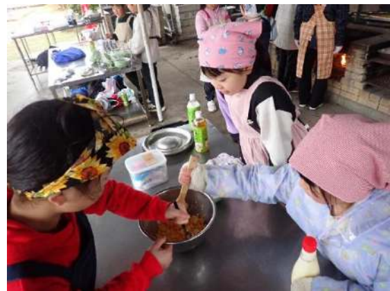
仲良く料理を楽しもう