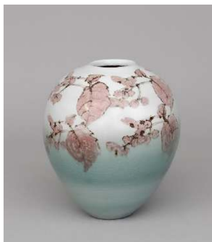
鉄絵銅彩秋海棠文壺 2025 作家蔵

約20点の新作をはじめ、「鉄絵銅彩」の技法、モチーフとする植物の秘密、公共空間に設置された作品の数々の紹介などを通し、陶芸家・神谷紀雄の魅力に多角的に迫ります。