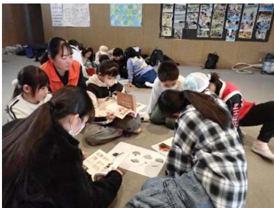
新しいお友達ができます