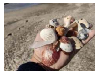
いろいろな種類の貝殻を拾えます