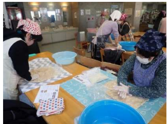
健康に良い発酵食品づくり