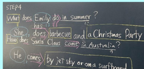
黒板を使った指導