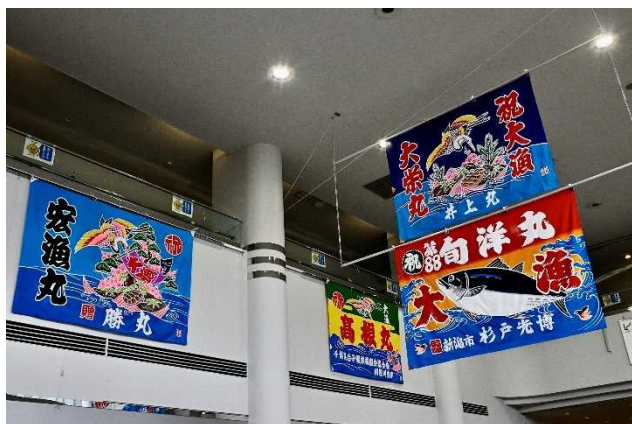
昨年度の展示の様子