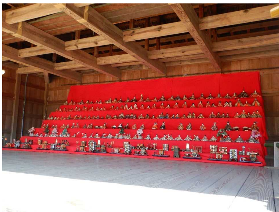
ビックリひなまつりの様子

※中学生以下、65才以上の方、障害者手帳等をお持ちの方およびその介護者1人は無料。