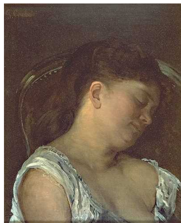
肖像画より クールベ《眠る人》