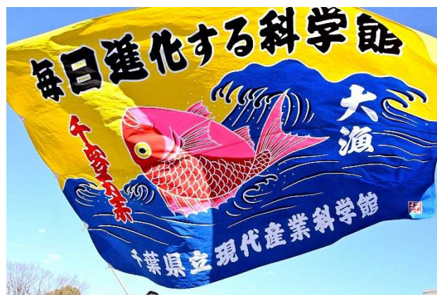
当館オリジナル萬祝式大漁旗