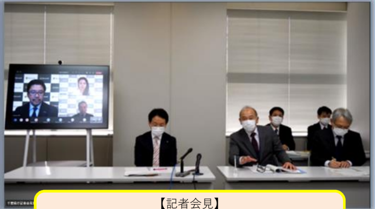
【記者会見】 その場にお集まりの記者様とオンライン参加の記者様から、たくさんの質問をいただきました。