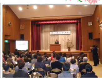
和田町ふるさとづくり発表会で提案