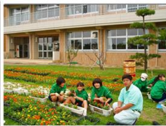
市内の小中学校を花でいっぱいにする運動