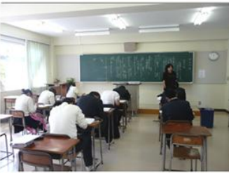
少人数指導や課題追求学習の充実