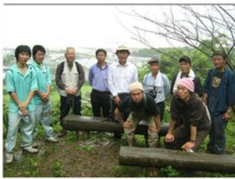
廃道を復活させるハイキングコースづくり