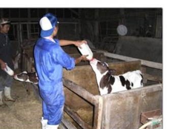
命を育む農場実習