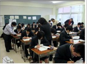
教師全員で教えるチャレンジタイム