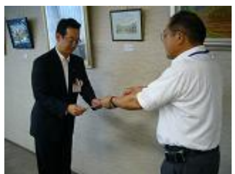
《千葉銀行での登録証の交付》

登録企業の取組内容や事業の詳細、申込書等は、県教委のホームページをご覧ください。