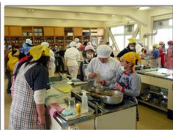
生徒が指導する親子食育教室