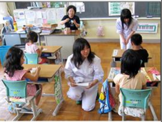
食育活動を通じた児童とのふれあい