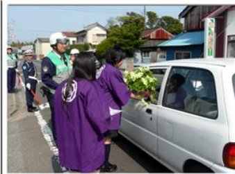
交通安全運動で花やダイコンを配布して啓発