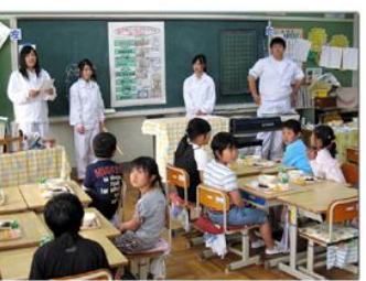
小学校でヨーグルトの作り方と栄養の説明