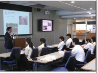
大学の講義を受講(高大連携)