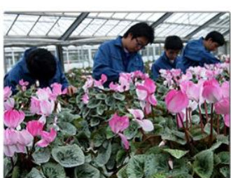
心を和ませる花の栽培

総合学科の特色を生かした科目選択制と少人数指導や課題追求学習等により、社会に必要な「確かな学力」の育成とともに、命を育む教育や人々との交流を通して「豊かな心」を育んでいます。