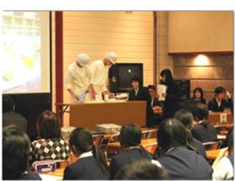
中学生や保護者に向けた総合学科学習発表会

学校で学んだ成果を地域活性化のために役立てています。様々な活動を通して、生徒は、自信と誇り、郷土への愛着を育んでいます。