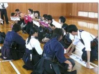
中国の高校生との交流