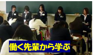
働く先輩から学ぶ

安房拓心高校の様子は、ホームページでも公開しています。 http://www.boso.net/takusin/