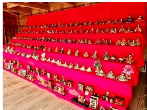
農村歌舞伎舞台での展示の様子