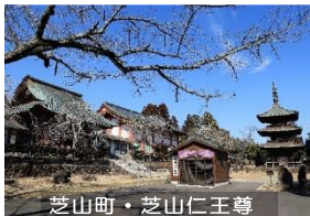
芝山町・芝山仁王尊