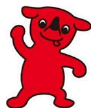
千葉県マスコットキャラクター チーパくん

iOSのアプリについては、必要に応じて機能制限と年齢制限を、個別に設定してください。