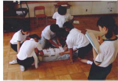
【救急法フェスタ基本練習】