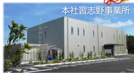
本社習志野事業所