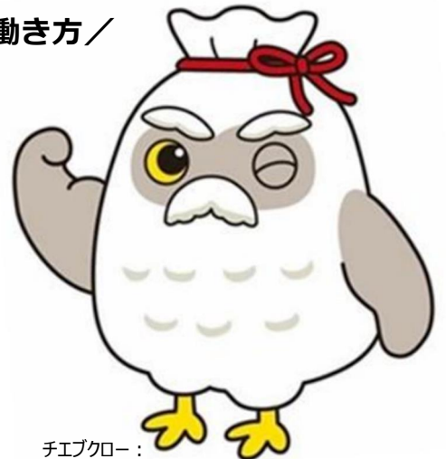
チエブクロー： シルバー人材センターのマスコットキャラクター