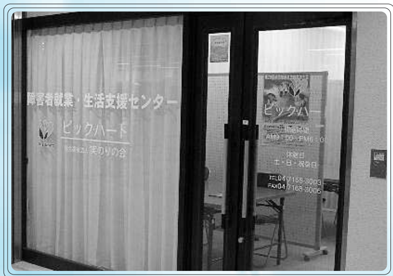
「障害者就業・生活支援センターピックハート」

具体的には、障害者職業センターや職業安定所、関係福祉施設などとの連携により、就業及びそれに伴う日常生活上の支援を必要とする障害者に対して、センター窓口での相談や、事業所に対して、障害特性を踏まえた雇用管理等に関する助言を行うほか、併設や連携している施設を利用した基礎訓練の実施、企業での実習、就職に向けた準備から就職後のフォローまで継続した就業支援を行います。 ⇨ 次ページへ続きます。