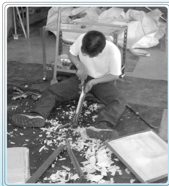
「知的障害者が働くリサイクル企業の解体風景」