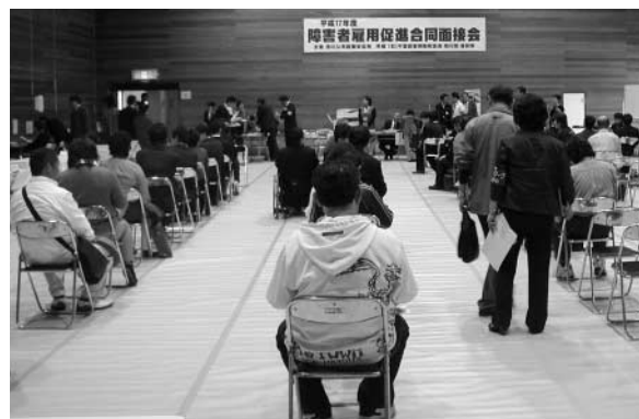
(平成17年度面接会風景：市川会場) ▶

事業所の方につきましては、障害者の雇用の促進のため、積極的な参加をお願いいたします。