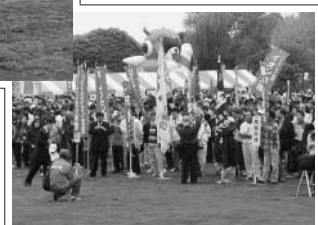
千葉ポートパークで行われた連合千葉系千葉県中央メーデー