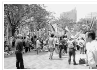
千葉市中央公園で行われた千葉労連系千葉県メーデー

なお、式典終了後は祭典に移り、トーク&ライブショーやチャリティ大抽選会等の催し物が行われました。