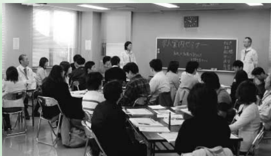
ジョブカフェちば出張版