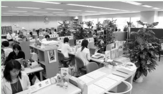
ジョブカフェちば

全てのサービスは、若者・企業共に、無料でご利用いただけます！ 皆様のご利用をお待ちしております。