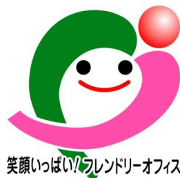
笑顔いっぱいフレンドリーオフィス