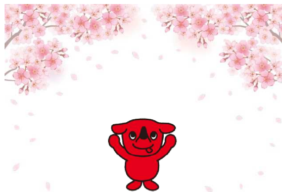
千葉県マスコットキャラクター「チーバくん」