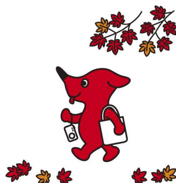
千葉県マスコットキャラクター「チーバくん」