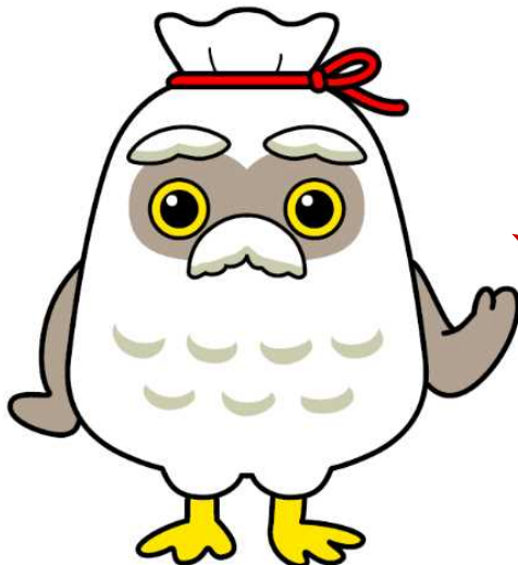
シルバー人材センター ゆるキャラ 「チエブクロー」