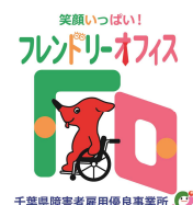
千葉県障害者雇用優良事業所