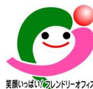
笑顔いっぱいフレンドリーオフィス

http://www.pref.chiba.lg.jp/sanjin/shougai/friendly/index.html