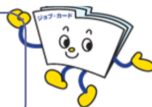
ジョブ・カードくん