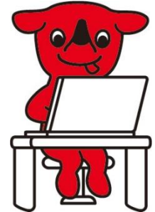
千葉県マスコットキャラクター チーバくん