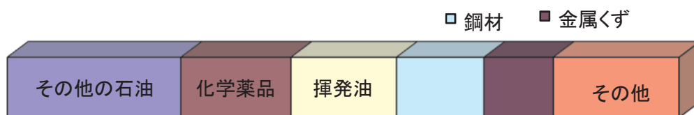
■輸出貨物主要品種別表