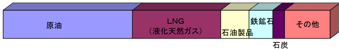
■輸入貨物主要品種別表