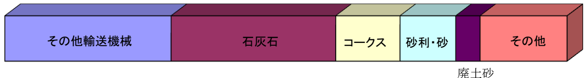
■移入貨物主要品種別表