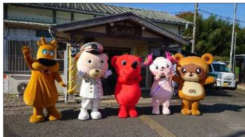
(久留里駅でのおもてなし)

4月29日(金)、5月21日(土)、 6月18日(土)、9月23日(金)、 10月10日(月)、11月12日(土)に 利用客へ協議会グッズ等を配布するなど、 おもてなしを実施した。