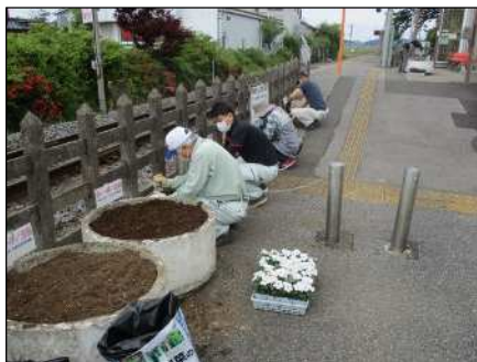
(東横田駅 中富ふれあいの会花いっぱい活動への協力)