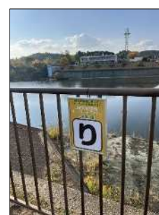
(キーワードパネルの設置)