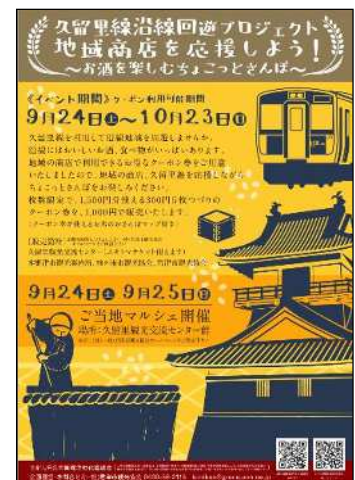
(イベントポスター)