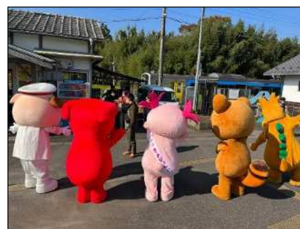
(久留里駅でのおもてなし)

久留里線「菜久留トレイン」の利用客に対して、おもてなしを行うことを通じて、久留里線のイメージアップを図った。