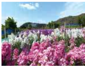
ストックのお花畑

2月中旬からは、ストックや食用菜花の摘み取り体験※も楽しめます。潮の香りと美しい景色の中で、ドライブの疲れを癒やしましょう。