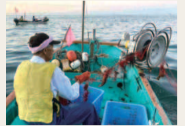
色鮮やかなイセエビが次々と揚がります

外房イセエビは「刺し網」と呼ばれる漁法で、海中にカーテンのように網を張り、海底を移動するエビを絡めて漁獲します。網を張る場所の精度と技術が求められ、漁師の長年の経験がものをいう刺し網漁。前日に仕掛けた網を夜明け前から揚げていき、陸で手際よく丁寧に網外し作業をすることで、鮮度の良いイセエビを出荷しています。また、禁漁期間や漁獲できる大きさが定められており、小さい物は再放流するなど、資源管理にも努めています。