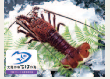
外房イセエビ(千葉ブランド水産物)

三重県の「伊勢」の名が付くイセエビですが、実は千葉県が漁獲量全国1位を誇ります(令和4年漁業・養殖業生産統計年報)。特に外房地域の太東・大原から勝浦にかけての沿岸は、豊富な餌に恵まれた岩礁帯が続くイセエビの好漁場。ここで漁獲されるイセエビを、県では「外房イセエビ」として「千葉ブランド水産物」に認定し、広くPRしています。荒波にもまれて引き締まったプリプリの身は市場でも高く評価されています。