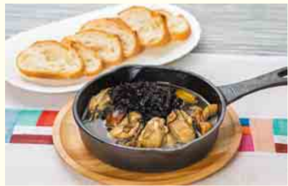
しょうゆが香るのりとカキの黒アヒージョ