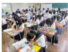
折り紙作品の製作

鎌ヶ谷西高校では、生徒たちの進路希望や地域からの要請などを踏まえ、平成30年度から選択科目として「保育」を導入しています。2年生では子どもの保育環境などを学び、3年生からは子どもの発達の特長や言語表現など、さらに専門的な内容を学習します。