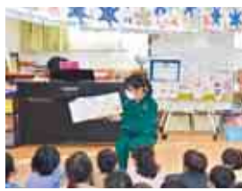
手作り絵本の読み聞かせ