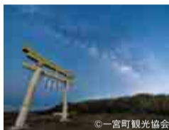
星空を眺められるスポットとしても有名

毎年9月に行われる「上総十二社祭り」の舞台であり、東京2020オリンピックのサーフィン競技会場にもなった釣ヶ崎海岸。海岸に新しくオープンした観光施設「ステラ釣ヶ崎」内の観光案内所では、大会で使用された表彰台や出場選手のサイン入りサーフボードが展示されています。