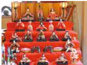
各家に伝わる大切な人形が飾られる

香取市佐原は江戸時代に水運で栄えた商家町。町内約20カ所の商店や周辺施設で、江戸・明治期から代々伝わるひな人形が飾られて、町全体で春のお祝いムードを演出します。おひなさまの展示はピンク色の招き布が目印。江戸情緒あふれる町並みを散策してみませんか。