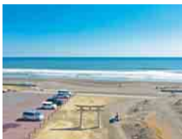
年間を通して良質な波が打ち寄せる

毎年9月に行われる「上総十二社祭り」の舞台であり、東京2020オリンピックのサーフィン競技会場にもなった釣ヶ崎海岸。海岸に新しくオープンした観光施設「ステラ釣ヶ崎」内の観光案内所では、大会で使用された表彰台や出場選手のサイン入りサーフボードが展示されています。