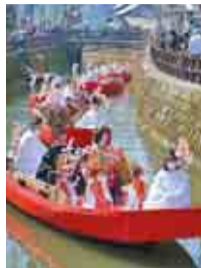
お内裏さまとおひなさまのパレード

期間 2月5日(日)～3月26日(日) (展示会場によって展示日時は異なります)