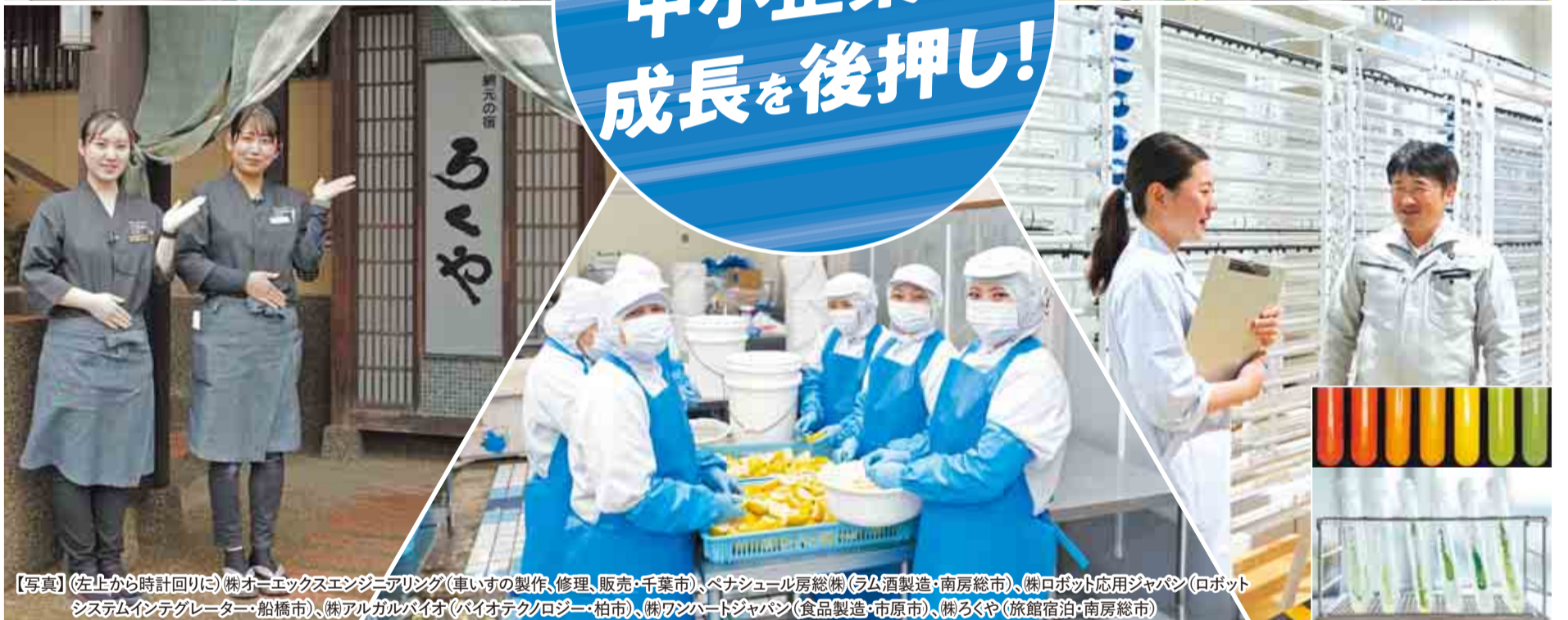
【写真】(左上から時計回りに) ㈱オーエックスエンジニアリング(車いすの製作、修理、販売・千葉市)、ペナシュール房総㈱(ラム酒製造・南房総市)、㈱ロボット応用ジャパン(ロボットシステムインテグレーター・船橋市)、㈱アルガルバイオ(バイオテクノロジー・柏市)、㈱ワンハートジャパン(食品製造・市原市)、㈱ろくや(旅館宿泊・南房総市)