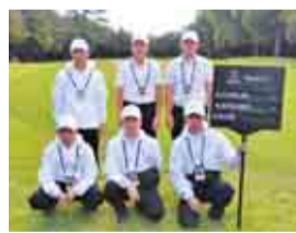
選手からサインボールもいただきました