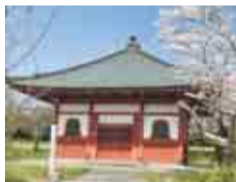
本堂内には県指定文化財の釈迦如来像などが安置されています