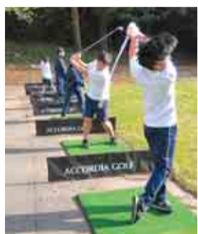
打つ姿勢に気を付けます

開校当初に千葉県出身のプロゴルファー飯合肇さんも携わり誕生したゴルフ部。現在7人の部員が、学校に隣接した習志野カントリークラブで打ちっ放しなどの練習をしています。他にも、総武カントリークラブなど実際のコースを借りて週に1回実践的な練習をしており、過去には2回、全国大会への出場経験もあります。