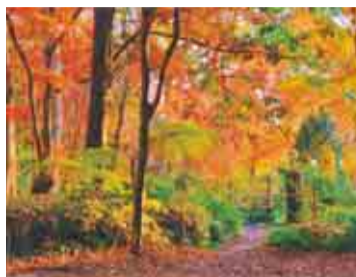
鮮やかなイロハモミジの紅葉