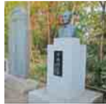
入り口には十枝雄三の碑と銅像があります

樹齢400年のクスノキやケヤキの他、イロハモミジが生えるこの森は、故十枝雄三の屋敷跡です。十枝家から市に寄贈され、現在は「十枝の森」として親しまれています。