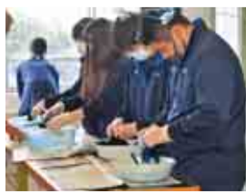
指導を受けながら染めます

白井高校では、さまざまな特色ある学習活動などを通して社会の一員として有為な人材を育てていきます。