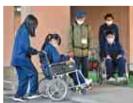
福祉体験学習の様子

福祉体験学習では、2人組になって、車いすの利用や視覚障害の疑似体験と、お互いを学校から駅まで誘導する体験を行います。また、大学と連携した取り組みとして、大学教授を招いての講座や、大学に在籍する留学生との国際交流体験など多様な教育活動も展開しています。