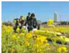
ドクターイエローの乗車体験も人気