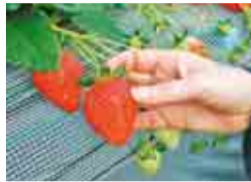
大粒のチーバベリーも人気です

山武市内には20軒以上ものいちご園があり、冬から春にかけては完熟いちごを味わいに多くの方が訪れます。市内各地の農園では、いちご狩りだけでなく、とれたていちごの直売や手作りジャムなどの販売もしています。