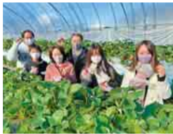
いちご狩りは朝イチがおすすめ!

中でも国道126号線沿いはいちご園が密集し、ストロベリーロードの愛称が付けられるほど。農園ごとに異なる品種のいちごを食べ比べるのもおすすめです。