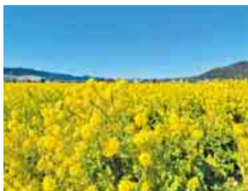
一足早い春の訪れを感じられます

鴨川中学校周辺の田畑を活用した、約1万坪の広大な敷地を菜の花が黄色く染め上げます。ミニトレイン「ドクターイエロー」の乗車体験もあり、フォトジェニックな風景を写真に収められます。