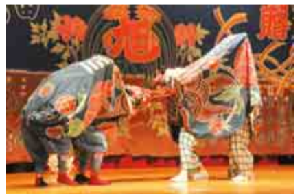
永田旭連の獅子舞