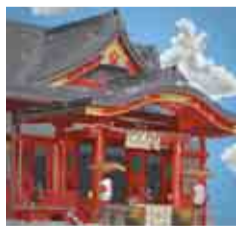
えんさんさんの作品