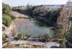
広大な自然が魅力です

約2.75haの広大な敷地に約1,000種、約1,000本のツバキが咲き誇る公園。開花時期がそれぞれ異なるため、訪れる時期によって色や形の違うさまざまなツバキが楽しめます。敷地内には、原生林や池もあり、野鳥や昆虫の観察もできます。