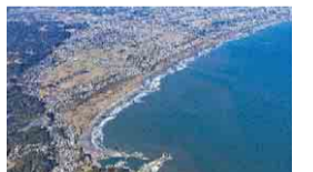
釣ヶ崎海岸(一宮町)