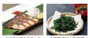
さばてり焼き skewer 全田産焼ばら乾海苔

県が自信を持っておすすめする「千葉ブランド水産物」の中から、2品をセットでお届けします！(お取り寄せもできます。千葉県産 お取り寄せ 検索)