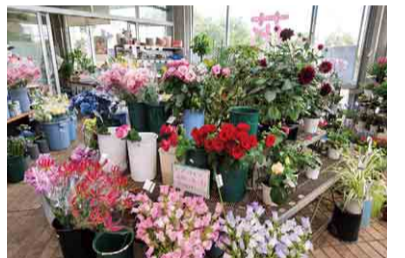
四季折々の花が店頭で販売されています

問い合わせ 道の駅やちよ(八千代ふるさとステーション) TEL047(488)6711