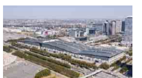
幕張メッセ(千葉市)