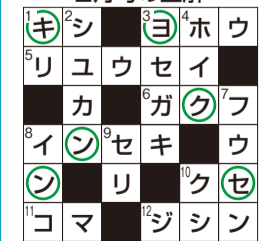
センキョクン(せんぎょ君)

便番号、住所氏名、年齢、電話番号などは県民だよりへの意見・感想を必ず書い、〒260-8667(住所記載不要)県報道広報課クイズ係へ(応募は1人1通まで)。締め切りは3月15日(必着)。正解者の中から抽選で30人に千葉ブランド水産物詰め合わせを贈呈。当選者の発表は発送をもって代えさせていただきます。また、いただいたご意見などは、今後の編集の参考にさせていただきます。2月号の正解者数は3542人でした。なお料金不足のはがきは受け取れません。 ※応募いただいた個人情報、プレゼントの発送のみに使用し、それ以外の目的には使用しません。