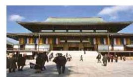
成田山新勝寺(成田市)