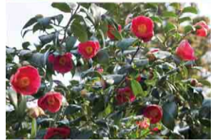
お気に入りのツバキを見つけてみませんか