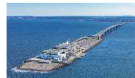
海ほたる(木更津市)

域を走ります。緑あふれる手賀沼公園や国際学術都市づくりが進む柏の葉エリアを通り、最後の松戸中央公園まで聖火をつなぎます。