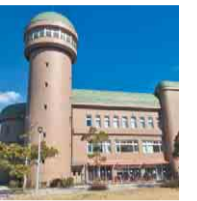
天気の良い日は富士山も望める水の館