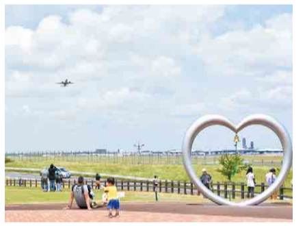
航空機と一緒に撮影できる人気スポット