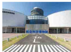
すぐ近くにある航空科学博物館

成田空港のA滑走路から約600mの距離に位置するひこうきの丘。迫り来る航空機の大きさが体感でき、さまざまな航空機が飛び交う景色や臨場感溢れるエンジン音も楽しめます。昨年5月に設置されたハートのモニュメントも人気の撮影スポットです。