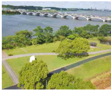
目の前に広がる広大な手賀沼

水の館 開館時間 9時～17時(農産物直売所9時～18時、レストラン11時～17時)