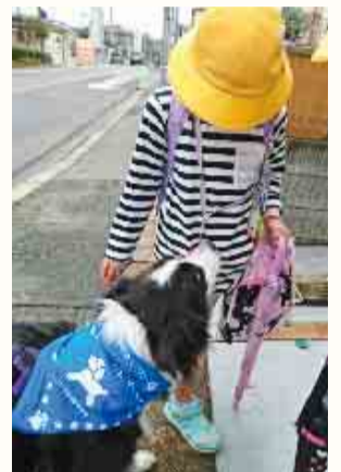
ワン隊員が見守ります

登下校の時間に合わせて、犬の散歩をしながら子どもの見守りに協力してくれる「わんわんパトロール隊員」を募集しています。千葉県獣医師会の会員病院で隊員登録をすることができます。